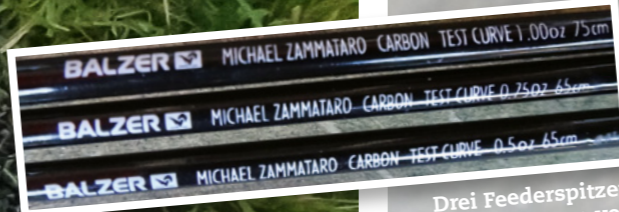
Drei Feederspitzen mit Testkurven von 0,5; 0,75 und 1 oz sind im Lieferumfang enthalten.