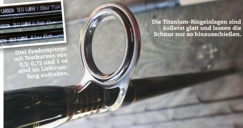
Die Titanium-Ringeinlagen sind äußerst glatt und lassen die Schnur nur so hinausschießen.

Bei der Beringung wurde nicht gespart, und so kommen Titanium SiC-Ringe zum Einsatz. Die Ringe stehen weit von der Rute ab, sodass die Schnur auch bei Regen nicht am Blank klebt.