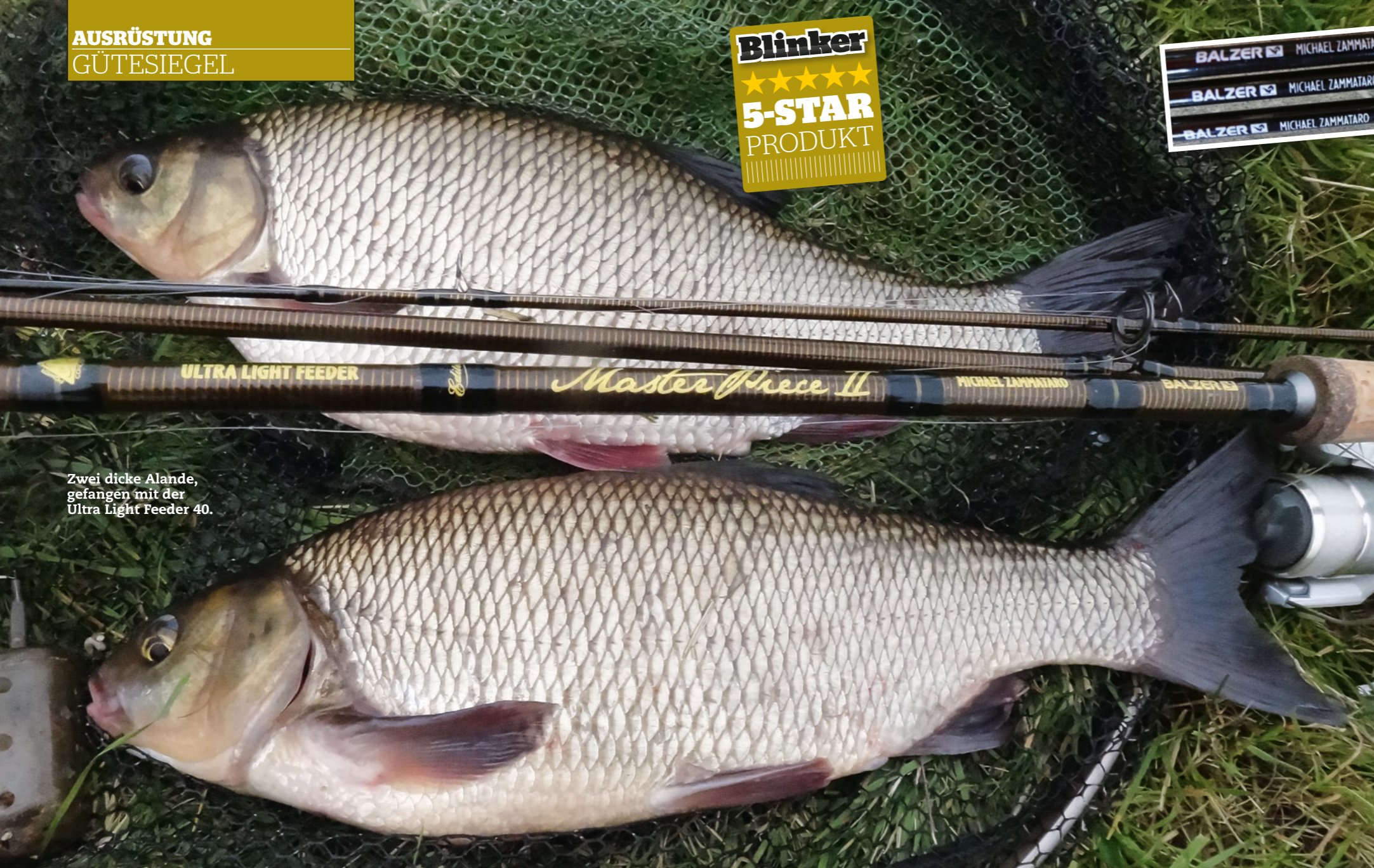
Zwei dicke Alande, gefangen mit der Ultra Light Feeder 40.