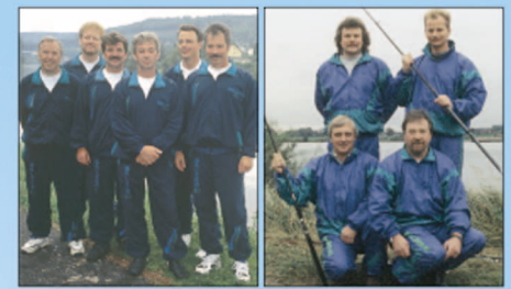
Die Balzer-Teams: Links Süßwasserteam, rechts Meeresteam